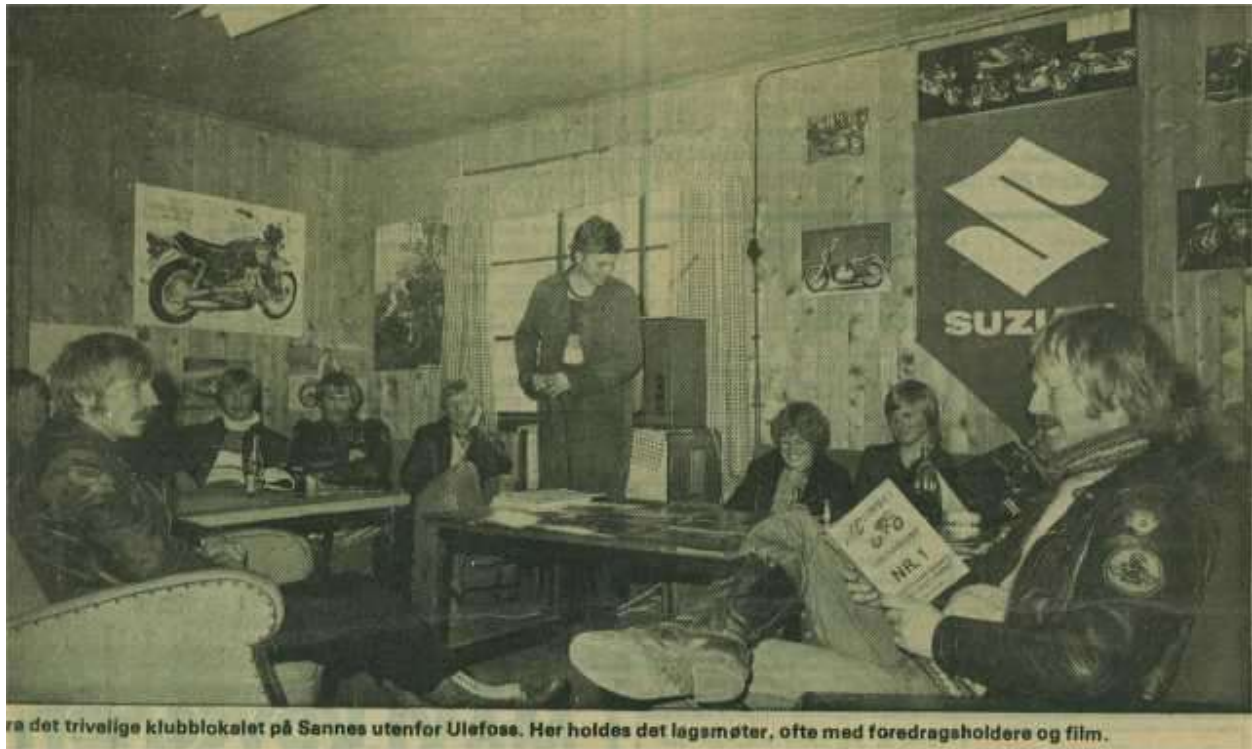
Oppholdsrommet til klubben på IPE Industrier.

I 1979 selges IPE Industrier, og den nye eieren krever høyere husleie. Klubben har få midler og ser seg ikke i stand til å klare den nye husleia. Kommunen går derfor inn for og subsidierer husleien. (kr. 200,-). Samme året kommer det flere nye medlemmer til klubben fra både Lunde og Bø.