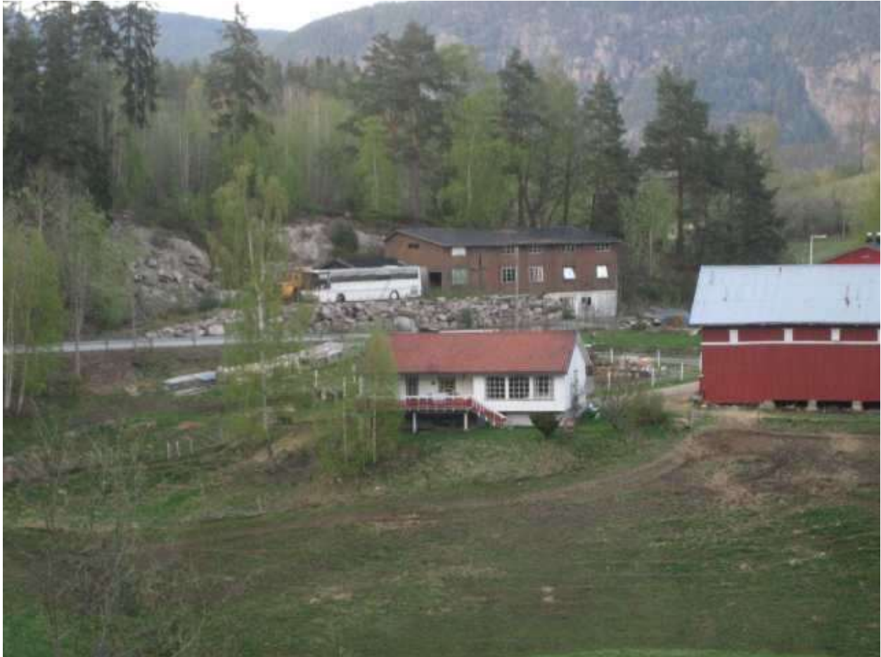
IPE Industribygg anno 2007 (brun bygning i bakgrunnen).

I starten manglet klubben egne lokaler, men i november 1976 fikk klubben til en leieavtale med IPE Industrier på Sannes.